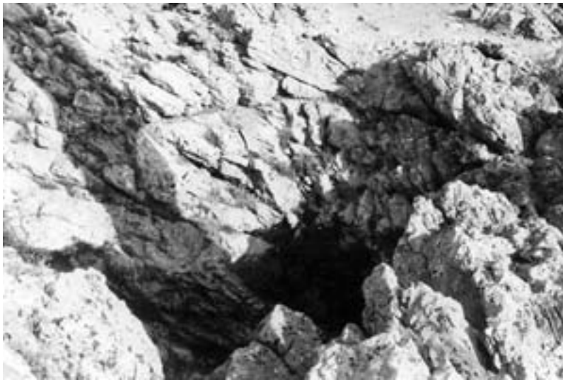
Гротло Шурманачке јаме Голубинке