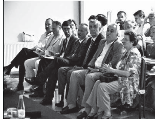
Први Симпозијум, 2008. године

Десети јубиларни међународни састанак хирурга у Фочи је добра прилика да се подсетимо на вријеме, људе и догађаје када је на иницијативу професора ентузијаста организован Први стручни састанак хирурга Србије и Републике Српске са међународним учешћем, посвећен оним колегама којих данас нема међу нама. Било је то 27. јуна 2008. године. Само одржавање састанка био је природан и логичан наставак сарадње Медицинских факултета Србије и Републике Српске.