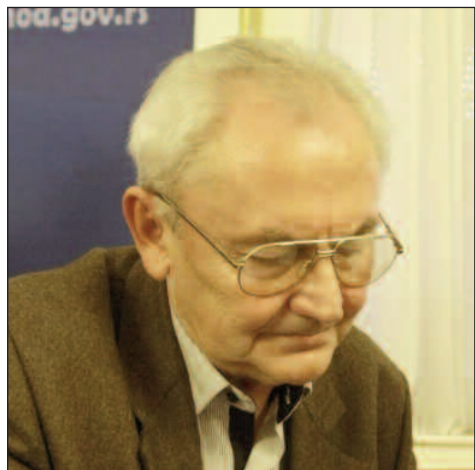
Ауѿор: Јован Мирковић

За преглед фотомонографије Јована Мирковића "Злочини над Србима у Независној Држави Хрватској" потребни су храброст и желудац, који може да поднесе све зло које је документовано у том делу. Убивства на кућном прагу, појединачна и групна вешања, стрељања, клања, насилна покрштавања и зверска мучења у логорима, злодела која су осмислиле и спровеле вође НДХ, здрав ум не може да разуме. Потресно сведочанство сортирано је у осам поглавља, а уз фотографије над којима би и камен заплакао, приложени су и факсимили расних закона НДХ.